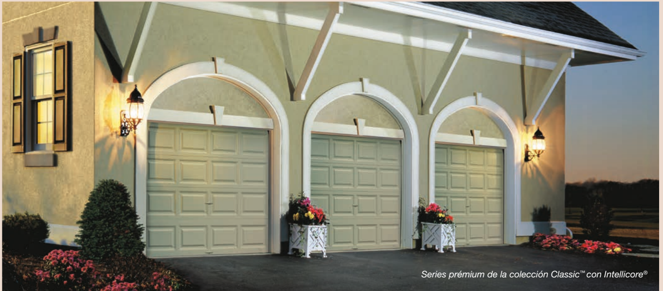
Series prémium de la colección Classic™ con Intellicore®